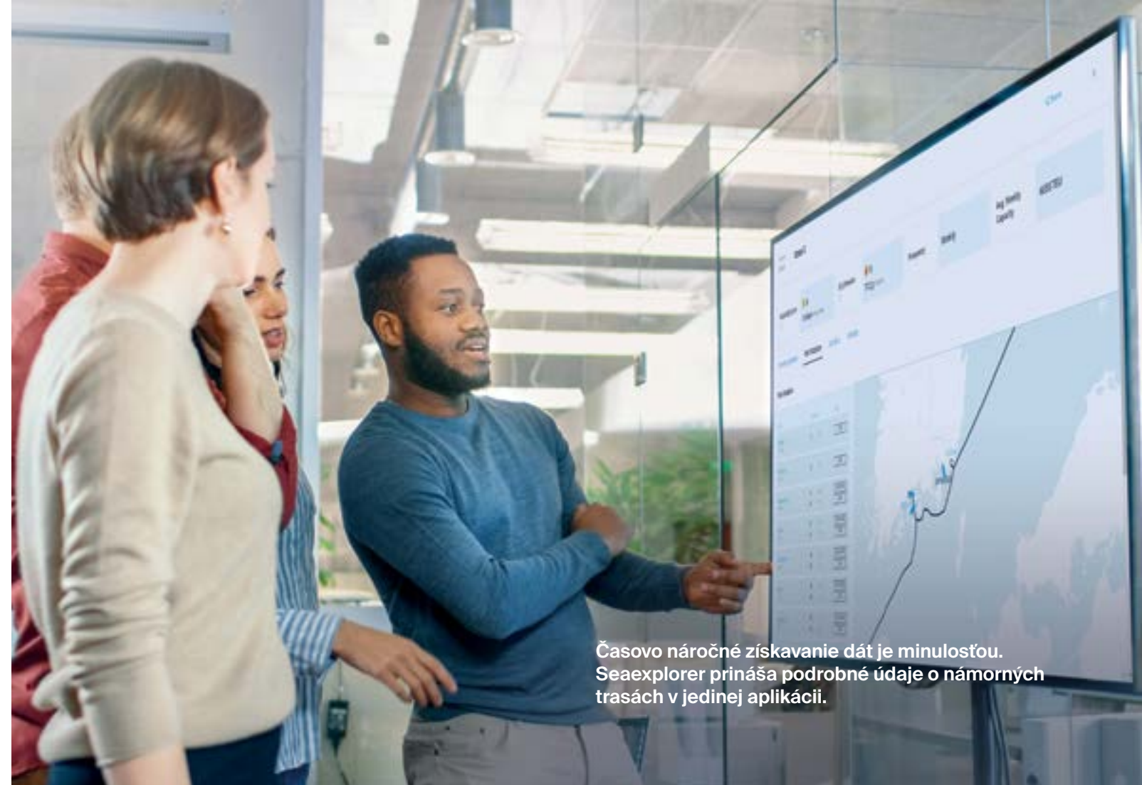
Časovo náročné získavanie dát je minulosťou. Seaexplorer prináša podrobné údaje o námorných trasách v jedinej aplikácii.